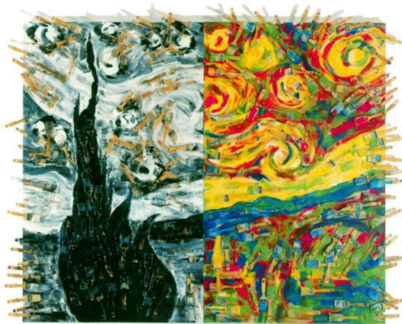
Arman, Double nuit , 1995, accumulation de brosses et acrylique sur toile, 210 x 265 x 10 cm