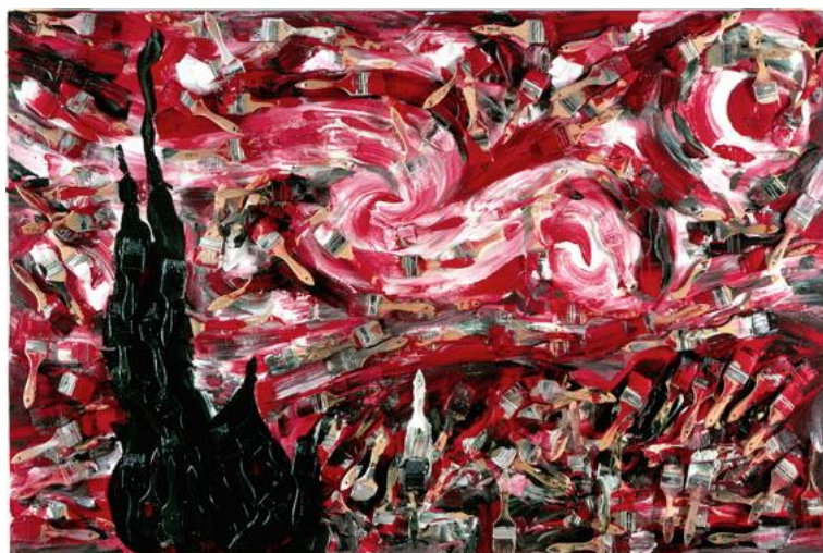
Arman, Après la nuit, l'aube , 1994, accumulation de brosses et acrylique sur toile, 122 x 183 cm