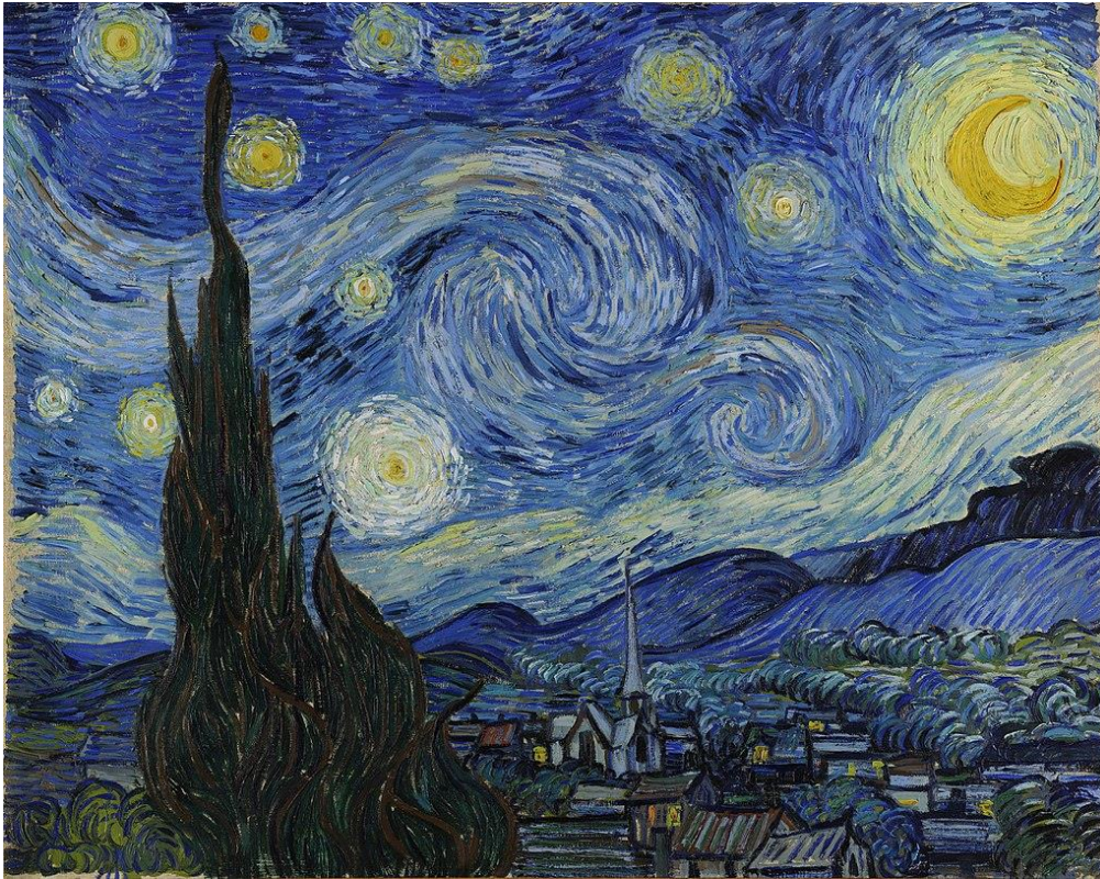
Vincent van Gogh, La Nuit étoilée , 1889, huile sur toile, 73 x 92 cm

« La Nuit étoilée » est l'une des peintures les plus célèbres de l'artiste peintre néerlandais Vincent van Gogh. Le tableau représente ce que Van Gogh pouvait voir et extrapoler de la chambre qu'il occupait dans l'asile du monastère Saint-Paul-de-Mausole à Saint-Rémy-de-Provence en mai 1889. Souvent présenté comme l'un des chefs-d'œuvre de l'artiste, le tableau est maintenant conservé au Museum of Modern Art (MoMA) à New York depuis 1941.